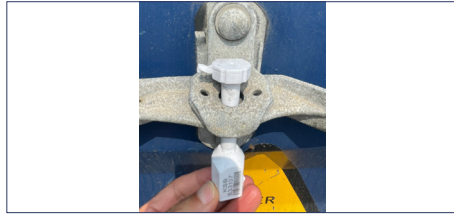
① 컨테이너 밀폐여부 (봉인장치 번호가 보이도록)