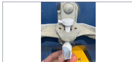
③ 컨테이너 밀폐여부 (봉인장치 번호가 보이도록)