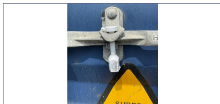
① 컨테이너 밀폐여부 (봉인장치 번호가 보이도록)