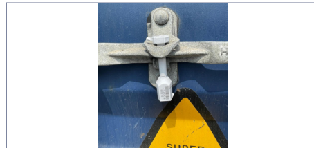
③ 컨테이너 밀폐여부 (봉인장치 번호가 보이도록)